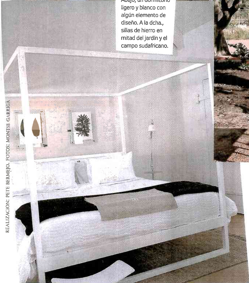
REALIZACIÓN: PETE BERMEO.