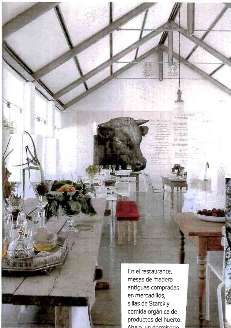
En el restaurante, mesas de madera antiguas compradas en mercadillos, sillas de Starck y comida orgánica de productos del huerto. Abajo, un dormitorio ligero y blanco con algún elemento de diseño. A la dcha., sillas de hierro en mitad del jardín y el campo sudafricano.